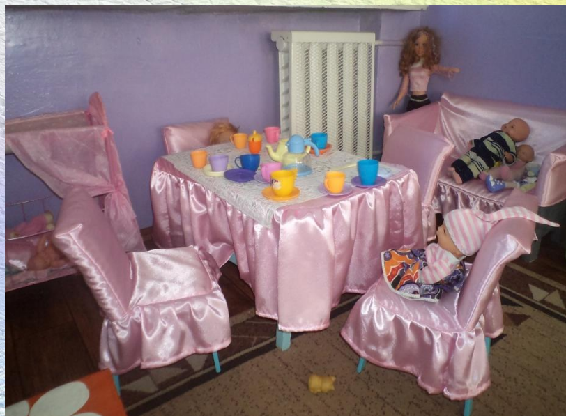
Створення розвивально-ігрового середовища